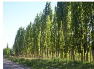
Modelo de muro vegetal

Como resultado de esta operación se espera reducir de forma considerable el ruido sufrido por los vecinos de Seseña como consecuencia del paso de la CM-4010 por el municipio. También se mejorará la percepción del espacio urbano, actualmente degradado por esta vía de circulación, que además, ha sufrido en años anteriores diversos incendios que han contribuido a deforestar la zona.